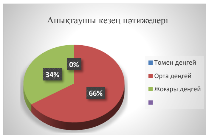
1-сурет – Тіл бұзылысы бар мектеп жасына дейінгі балалардың анықтаушы кезең тапсырмалары бойынша көрсеткен нәтижелері

Эксперимент жұмысының нәтижесі жоғарыдағы кестеде көрсетілді. Тапсырмаларды орындау кезінде балдық-деңгейлік жүйе бойынша бағаланды және осы көрсеткіш негізінде балалардың барлық тапсырма бойынша деңгейлері анықталды. Нәтиже суретте көрсетілген.