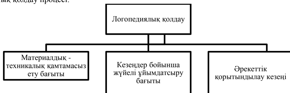
Сурет 2. Логопедиялық қолдаудың ұйымдастырушылық – технологиялық бағыттары

Түзету функциясы – бұл балаға травматикалық әсерді түзетуді және ақаудың қайталама немесе психологиялық салдарын тудыратын факторларды бейтараптандыруды қамтитын психологиялық-педагогикалық қолдау процесі.