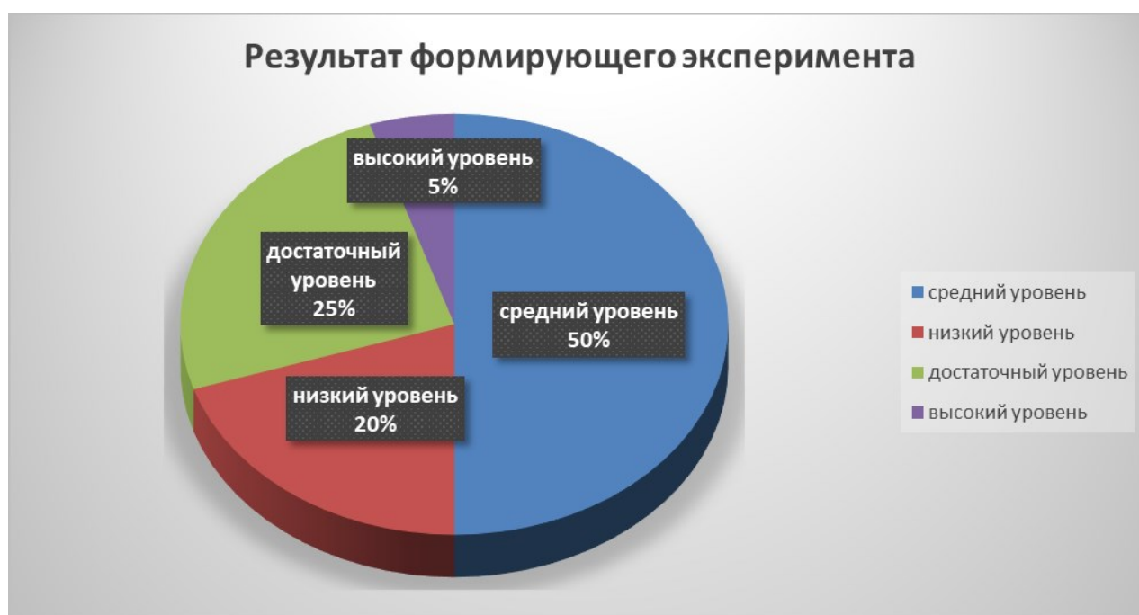
Рис 2 – Результат формирующего эксперимента

Согласно сравнению результатов констатирующего и контрольного экспериментов мы выявили, что работа по коррекции диалогической речи, дошкольников с ОНР III уровня, которая была проведена в экспериментальной группе посредством игр-драматизаций, была эффективной. После проведения с дошкольниками с ОНР III уровня формирующего эксперимента, у дошкольников отмечался достаточный диапазон артикуляционных движений, дошкольники не пропускали и не смешивали звуки, лишь иногда отмечались искажения свистящих, шипящих и соноров. Таким образом, после проведения формирующего эксперимента средний уровень повысился на 20%. У дошкольников сформировался высокий уровень развития диалогической речи.