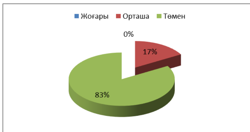
2-сурет. Г.А.Урунтаева және Т.А.Комарова әдістемесі бойынша балалардың сурет бойынша әңгіме құрастыру дағдыларын диагностикалау (анықтаушы эксперимент)