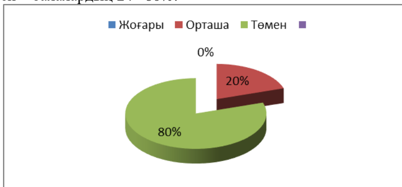
1-сурет. Г.А.Урунтаева және Т.А.Комарова әдістемесі бойынша балалардың еркін әңгімелесу, еркін қарым-қатынас орнату дағдыларын диагностикалау (анықтаушы эксперимент)