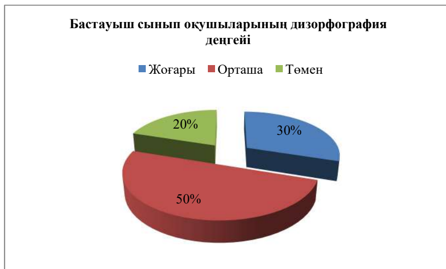
Сурет 1 – Бастауыш сынып оқушыларының дизорфография деңгейі

Сонымен бастауыш сынып оқушыларының дизорфографиясын диагностикалау мақсатында мақаланы жазу кезінде 3 – сынып оқушыларының дизорфография деңгейін зерттеген болатынбыз. Экспериментке 27 оқушы қатысқан болатын. Осы мақсатта оқушыларға диктант жазғызған болатынбыз. Диктантты бағалау арқылы бастауыш сынып оқушыларының дизорфография деңгейі анықталды. Эксперимент нәтижелері 1,2 – суреттерде ұсынылды: